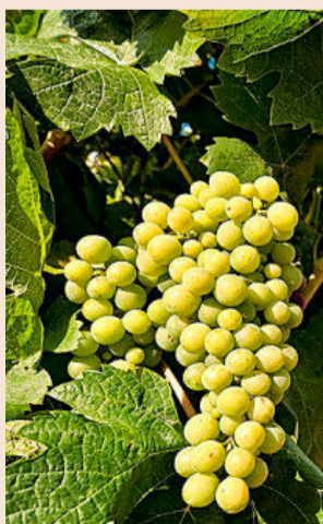
Algunas bodegas de la DO iniciaron la vendimia el pasado día 11 de agosto.

El consejo regulador de la DO Catalunya señaló ayer